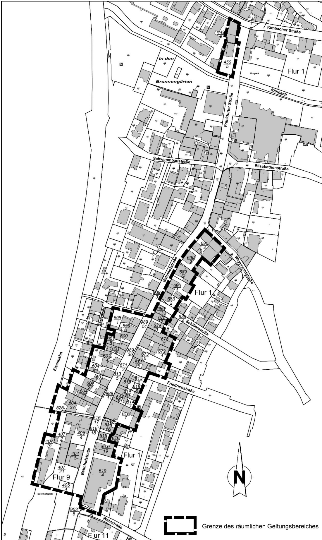
Datengrundlage: Amtliches Liegenschaftskatasterinformationssystem (ALKIS) der Hessischen Verwaltung für Bodenmanagement und Geoinformation